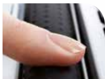
● Barre de contrôle texturée