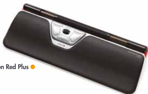
Version Red Plus ●